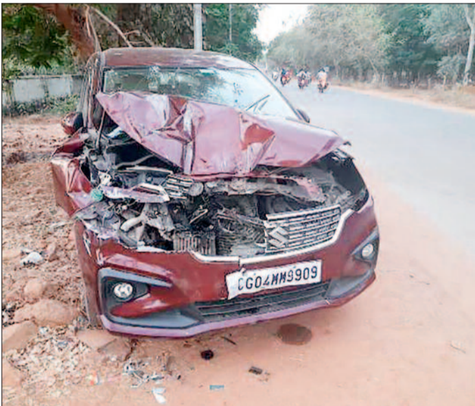
कार चालक कंट्रोल नहीं कर पाया और मोटर सायकिल को टोक दिया। मोटर सायकिल चालक नीचे गिर पड़ा और उसकी मोटर सायकिल हवा में लहरा गई। टोकर

ये घटना 24 फरवरी को दोपहर 12 बजे के बाद फिंगेश्वर पुलिस थाना से कुछ ही दूरी में दर्रापर जाने वाली चौक सड़क पर होना बताया गया है। कार चालक महासमबताया जा रहा है जो घटना के बाद घटना स्थल से कुछ ही दूर में कार छोड़कर चला गया है। कार की हालत देखोगे तो चौक जाओगे। वही मोटर सायकिल को टोकर मारकर वह बुरी तरह से डेमेज हुआ है। प्रत्यक्ष दशियों ने बताया कि बाइक चालक सड़क पर था और बस के रूकने पर वह भी रूका लेकिन पीछे से तेज गति में आ रहा